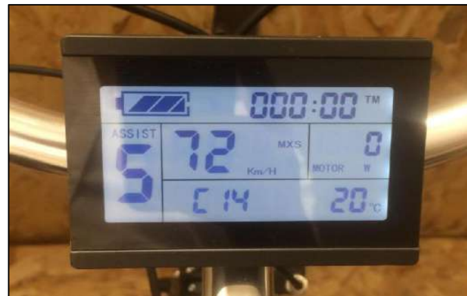
Cruiser 2, Light et Speed

*Attention : Les paramètres de votre vélo doivent être les mêmes que dans ce guide, car tout problème que vous pourriez avoir avec le vélo en changeant ces paramètres pour d'autres, mettrait le vélo hors garantie .