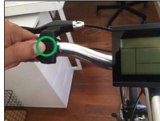
Cruiser 2, Light et Speed