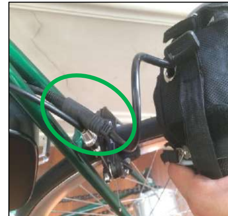
Light et Speed

Connectez le câble de la batterie a celui du vélo et appuyez sur le bouton en position de marche.