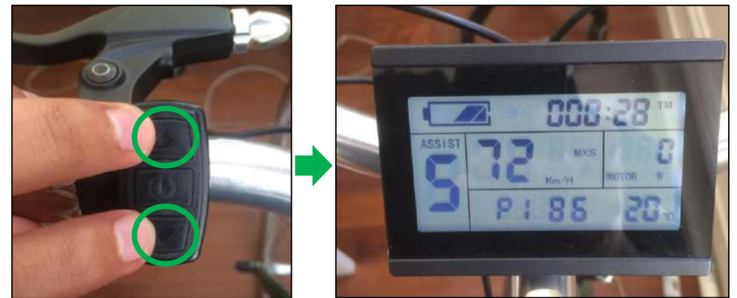
Cruiser 2, Light et Speed